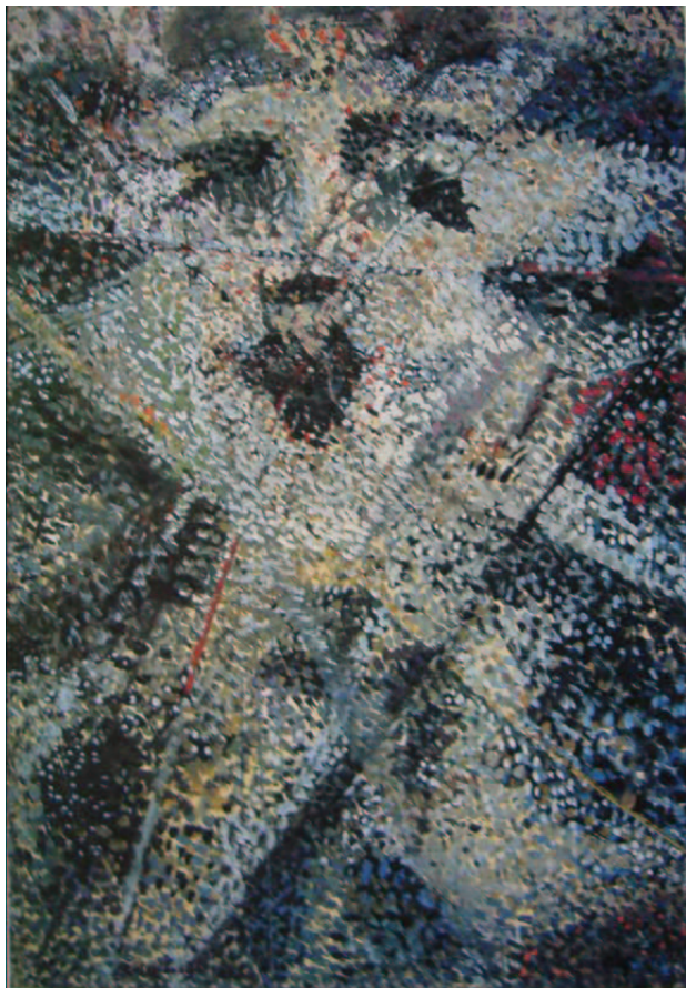
Fig. 3. Portret vetra

tutto il periodo staliniano 28 . Il rifiuto e la fuga dalla società portava quindi l' andegraund nella sua interezza a vivere una vita propria, per la quale si ignorava ciò che stava in superficie e non si avanzavano richieste di alcun tipo 29 , se non quella appunto di essere lasciati liberi di creare e di cercare un nuovo linguaggio espressivo.