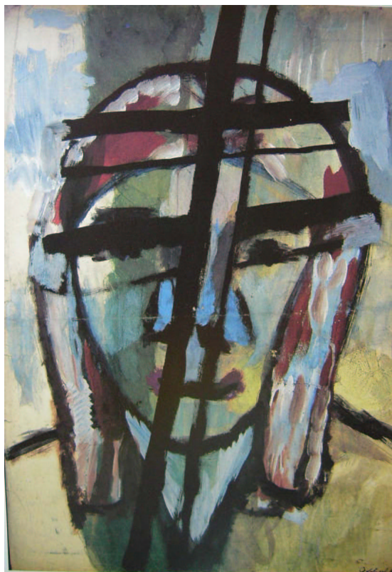
Fig. 9. Lico s izobraženiem kresta

L'altra serie principale di Jakovlev è quella dei ritratti, che a differenza dei fiori sfuggono a qualsiasi classificazione. Sono fatti sempre con stili e tecniche diversi: ci sono ritratti geometrici, come il ritratto del collezionista L. Taločkin [fig. 8]; ritratti più espressionisti, dove i lineamenti del viso sono dati da macchie di colore; ritratti nei quali il viso del soggetto è tagliato da una croce [fig. 9]. Se i fiori hanno un carattere spiccatamente meditativo e ispirano in genere pace e serenità 94 , i ritratti invece