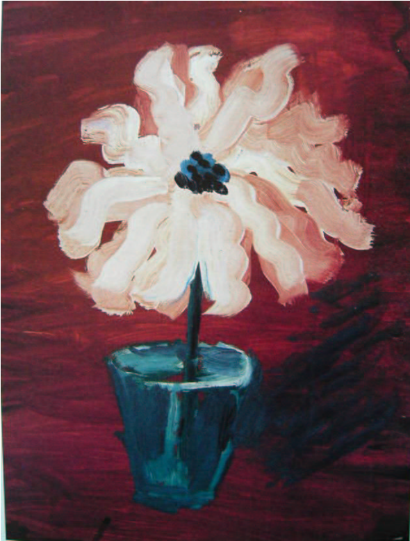
Fig. 6. Cvetok

attirava appassionati d'arte e curiosi. Questi arrivavano sia per vedere le sue opere, sia per ammirare il padrone di casa: un uomo alto, barbuto, che girava a torso nudo o con una camicia tutta bucata, ma che sapeva anche in ogni momento trattare i suoi ospiti da vero gentiluomo 73 .