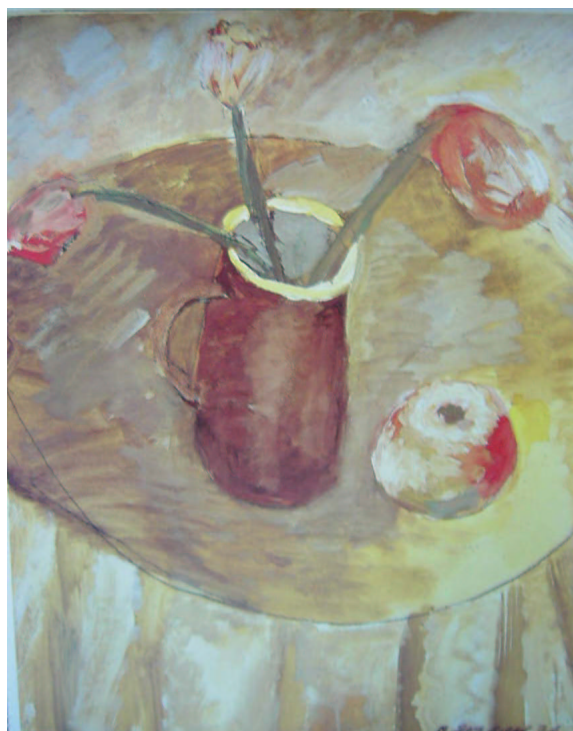
Fig. 7. Tjul'pany v koričnevom kuvšine

di Jakovlev, che spesso sfugge alla comprensione della ragione.