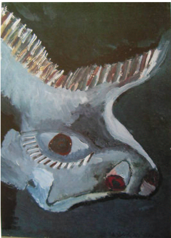
Fig. 5. Golova zverja

si distinguesse per il deciso rifiuto di qualsiasi tipo di struttura regolata e di vita organizzata: non solo non tolleravano il sistema sovietico, ma nemmeno quello occidentale; come non sopportavano la vita ufficiale, così non accettavano quella dell' andegraund . Questa spinta nichilista era talmente forte che si trasformò in autodistruzione: all'inizio degli anni Sessanta il padrone di casa cominciò ad assumere stupefacenti e a lasciar andare lentamente in rovina il suo salotto, che finì accidentalmente bruciato nel 1962, segnando così la fine – anche materiale – dell'esistenza del gruppo. Una tendenza all'autodistruzione che è la caratteristica principale dei vasil'evcy , tutti in qualche modo "altri" rispetto non solo alla media sovietica, ma anche a quella dei "colleghi" non-conformisti: molti di essi erano mentalmente instabili o conobbero una morte tragica e prematura 57 .