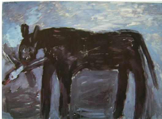
Fig. 4. Koška s pticej

martellante massificazione imposta dallo stato sovietico, l'artista andegraund sottolineava la propria individualità e la propria vita interiore come motore del fare artistico 38 .