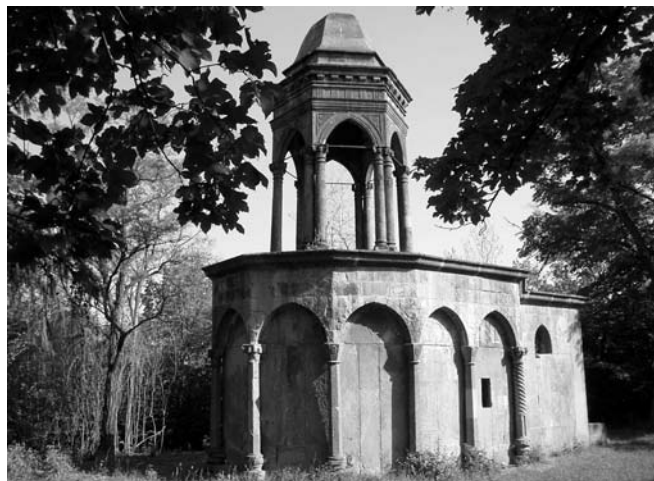
Slaný, kaple Božího hrobu, vysvěcená Harrachem v roce 1665.

75 „Doppo pranso andassimo a Sslana per vedere la fiera, la giongessimo così tardi, che già se n'erano andati i mercanti, non v'era da comprare, che spille, specchi, e fettucce di mezza seta. Vedessimo la fontana dell'acqua, che è così salutare, e tandem il santo sepolchro consacrando, che è ben scommodo assai per tal funtione", Wien,