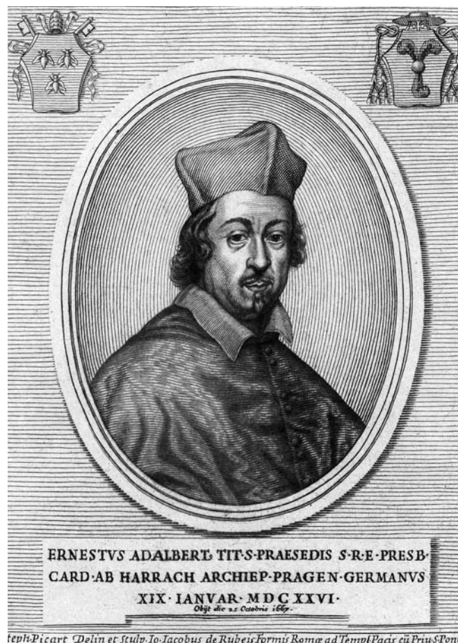
Kardinál Arnošt Vojtěch z Harrachu na dobové grafice.

bez výhrad soubhlasili), Bernard výbrady měl. “ 8 Jinak to byl také on, který „ lstivými radami a podvodnými dopisy u dvora navzdychky zhabil arcibiskupské volby “ 9 duchovní stav a který „ rozdmýšbával nepřátelství proti univerzitě nebo jezuitům “ 10 a „ usiloval [...] zabládit pražskou univerzitu “. 11 Důvodem Martinicova zanevření na jezuity byla podle Balbína touha, „ aby jeho jméno při obřadech znělo z kazatelen našich kostelů, aby je řídil nebo si alespoň zajistil pověst “. O kus dále se ještě poněkud nejasně praví, že „ nedokázal proniknout až k podstatě jezuitského řízení a rozhodování “. 12