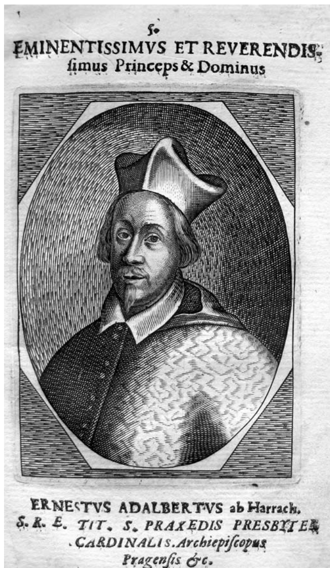
Kardinál Arnošt Vojtěch z Harrachu na dobové grafice.

panovníkem a vyslanci, tak i mezi soukromými osobami. Tyto psané noviny putovaly přes celou Evropu a často představovaly pro toho, kdo si je mohl dovolit zaplatit, mnohem lepší zpravodajství než noviny tištěné. V rodinném a příbuzenském kruhu umožňovaly udržet kontakty i ve fázi, kdy se vztahy tříštily v důsledku narůstající potřeby cestovat.